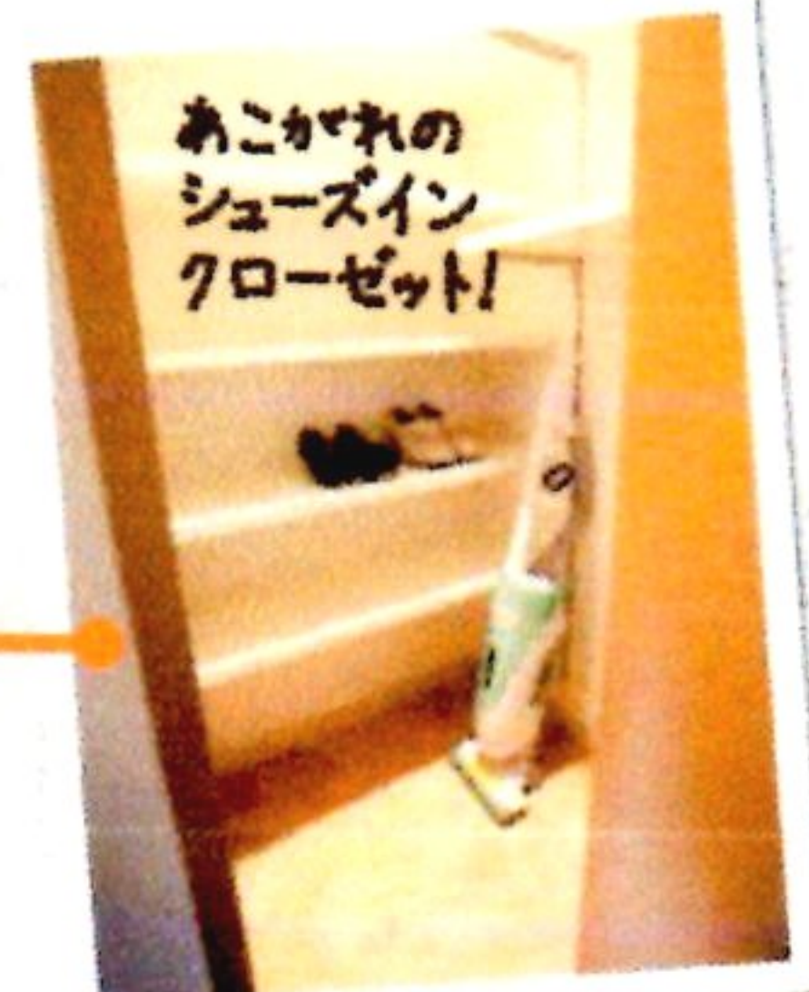
ブーツはもちろんゴルフバッグなどもラクラク収納できます。