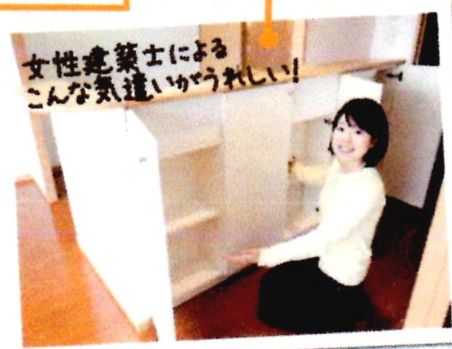
カウンター下に収納スペースを食器棚として利用すれば、食器棚を買う必要がない。