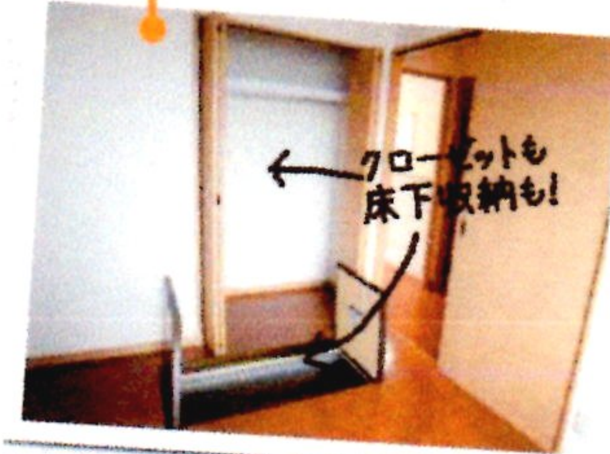
各部屋にクローゼットと床下収納スペースあり。家族が増えて、荷物がが増えても対応できるのがうれしい。